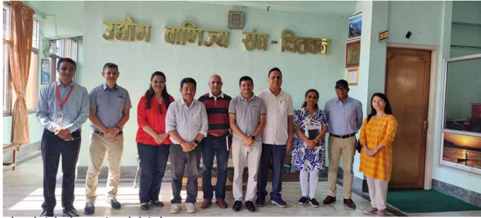
राजेन्द्र ओलीको समेत सहभागिता रहेको थियो ।